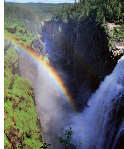
Hällingsåfallet – en sevärhet utöver det vanliga

Vilseledaren: Ett guidekoncept med akti-