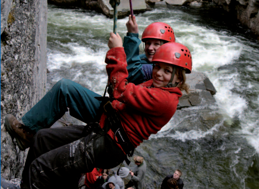
Fira dig ned i norra Europas längsta vattenfyllda kanjon – ett av äventyren i Vilseledaren.